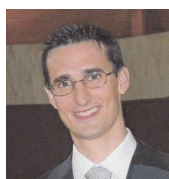
VILLA ANTONIO 1973 – MILANO 20 Pellegrinaggi Vice Responsabile Comm. Vita Associativa – Membro Comm. Famiglia