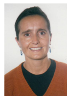
STRADA LUISA 1965 – MILANO 16 Pellegrinaggi Vice Responsabile Comm. Formazione. Conduzione visite guidate