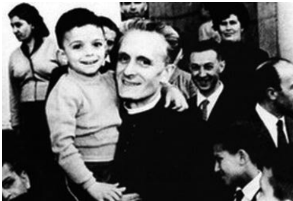
A destra: don Carlo con i suoi mutilatini; sotto: don Carlo con sua madre.